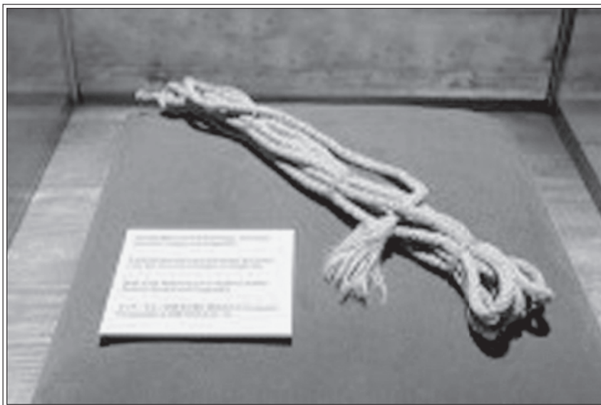
Museo della montagna di Zermatt. Spezzone della corda che legava la guida Peter Taugwalder al giovane lord Francis Douglas, sfilacciata nello strappo della caduta dei primi quattro componenti la cordata.

Come mai fosse maturato in Whymper questo testardo desiderio di vittoria? Orgoglio, spirito di neofito approdato casualmente all'alpinismo e da esso contagiato? Ambizione di primeggiare nel ristretto Gotha dell'Alpine Club?