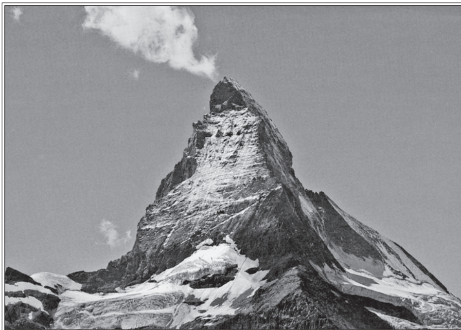
Il Cervino con la via nord-est (cresta dell’Hörnli) percorsa da Whymper e compagni.

Il 15 sera arriva al Breuil la conferma della salita degli inglesi al Cervino, che era stata preceduta da un momento di euforia nazionale, perché Felice Giordano che seguiva da fondo valle gli eventi aveva interpretato il movimento d’uomini sulla vetta come vittoria italiana e si era affrettato a far spedire da Chatillon all’amico Sella un telegramma d’esultanza.